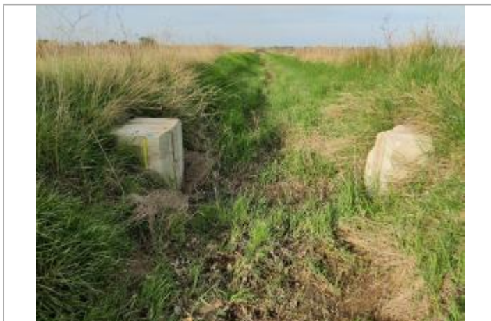
Batardeau de fossée