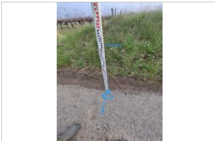
Talus en bord de chemin