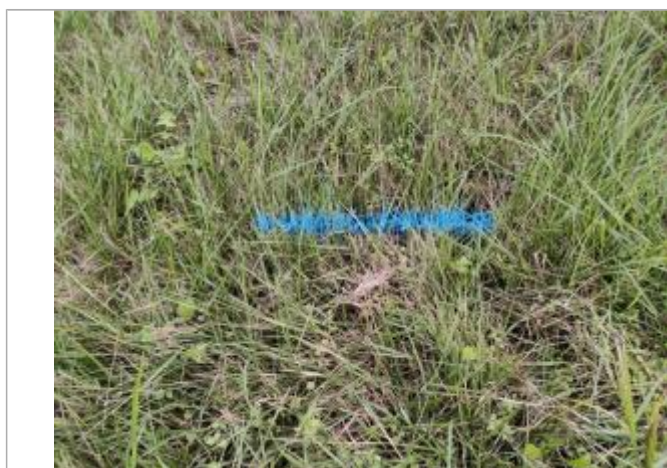
Dépôt contre le talus

Altitude calculée de l'eau (en m) : 2.795