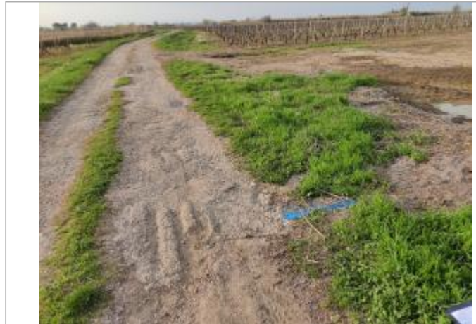
Bord de chemin

Coordonnées WGS84 : X: 3.30821900 / Y: 43.27735820