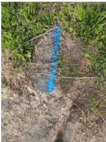
Dépôt en bord de chemin

Altitude calculée de l'eau (en m) : 2.79