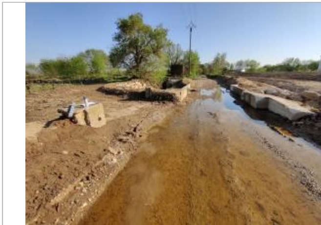
Massif béton, ancien batardeau