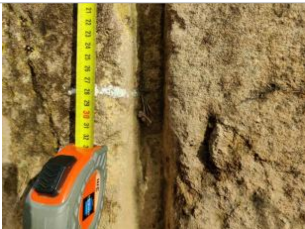
Trace sur la culée du batardeau

Altitude calculée de l'eau (en m) : 2.818