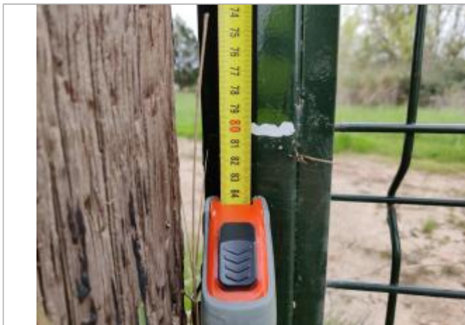
Trace sur le portail