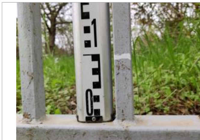
Trace sur le portail