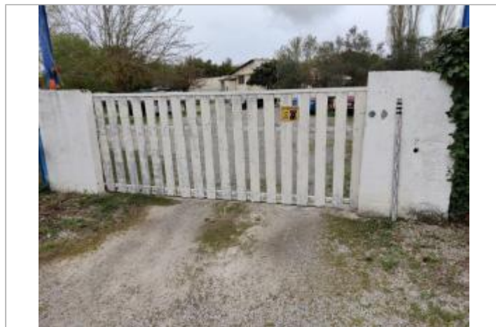
Mur à droite du portail

GÉOLOCALISATION Coordonnées WGS84 : X: 3.31136720 / Y: 43.31433050 Coordonnées RGF93 (Lambert 93) X: 725274 / Y: 6246180 Coordonnées RGF93 (ETRS89) : X: 3.3113672 / Y: 43.3143305 Code Hydro: Y25-0400 Rive de référence: Gauche