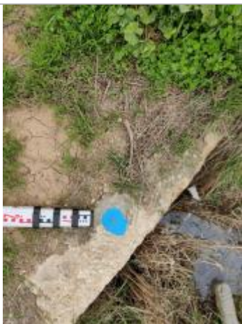
Dépôt sur le ponceau