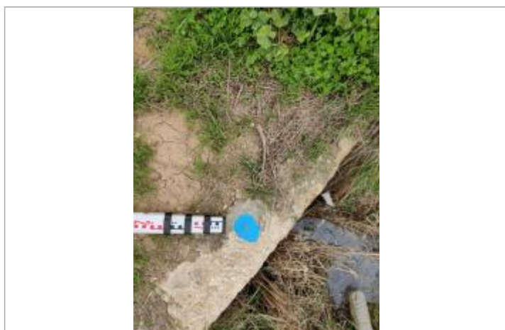
Dépôt sur le ponceau