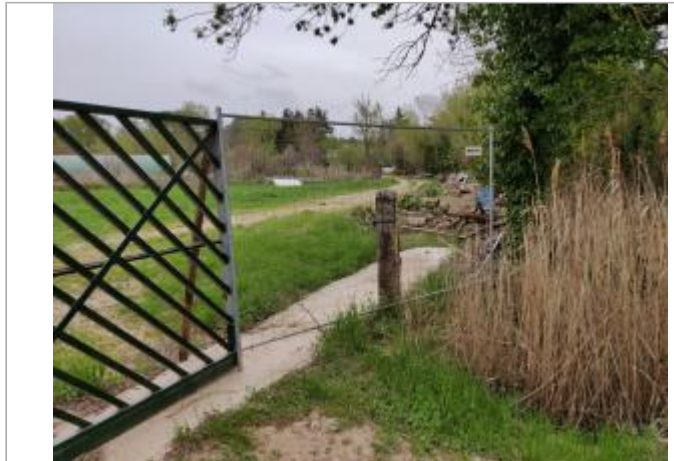
Poteau en bois

Coordonnées WGS84 : X: 3.32641890 / Y: 43.30356310