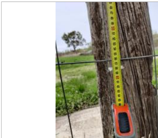
Trace sur le poteau

Altitude calculée de l'eau (en m) : 2.475