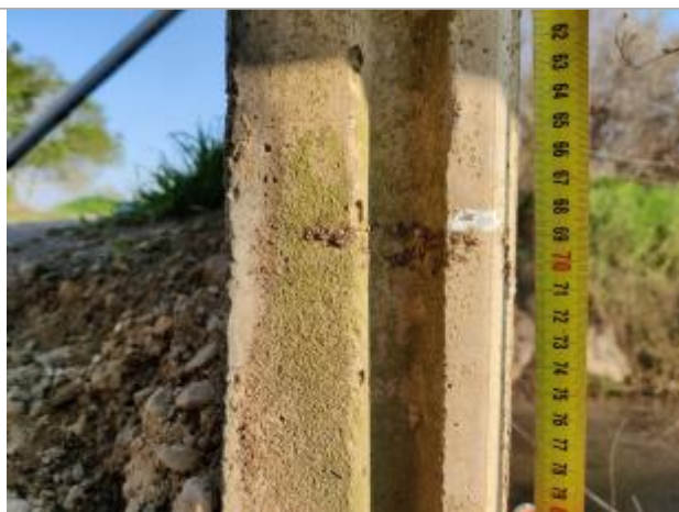
Trace sur le garde-corp

Altitude calculée de l'eau (en m) : 2.449