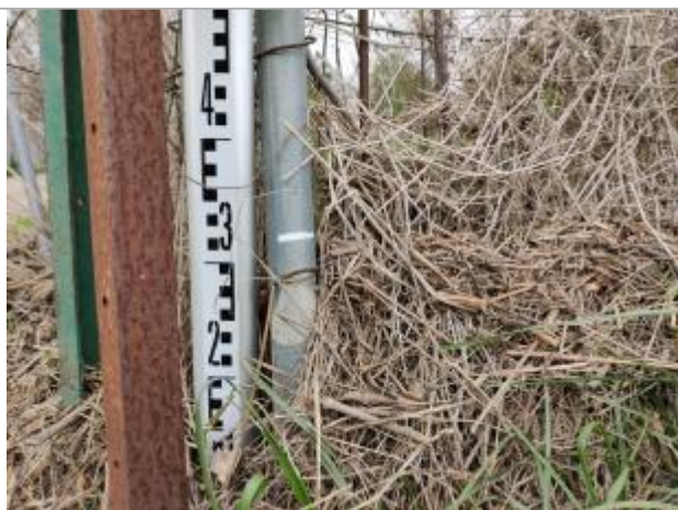
Dépôt contre la clôture