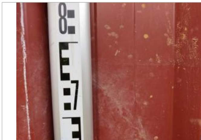
Trace sur le portail