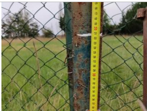
Trace sur le montant