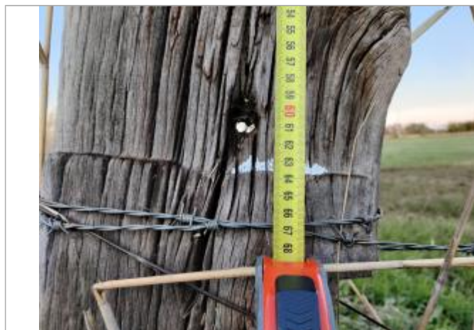
Trace sur le poteau

Altitude calculée de l'eau (en m) : 2.293