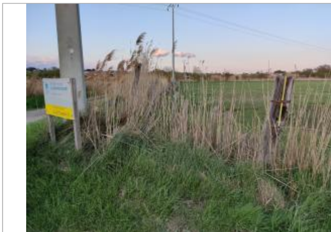
Poteau de clôture