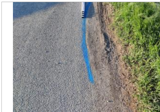
Dépôt sur la chaussée

Altitude calculée de l'eau (en m) : 2.16