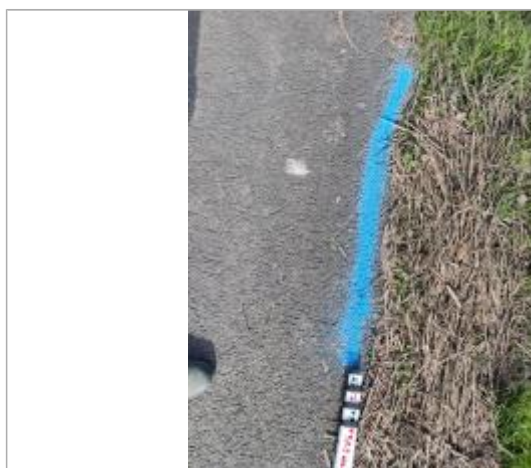
Dépôt au bord de la route