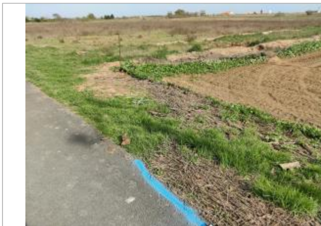
Bord de route

Coordonnées WGS84 : X: 3.30538310 / Y: 43.26679650