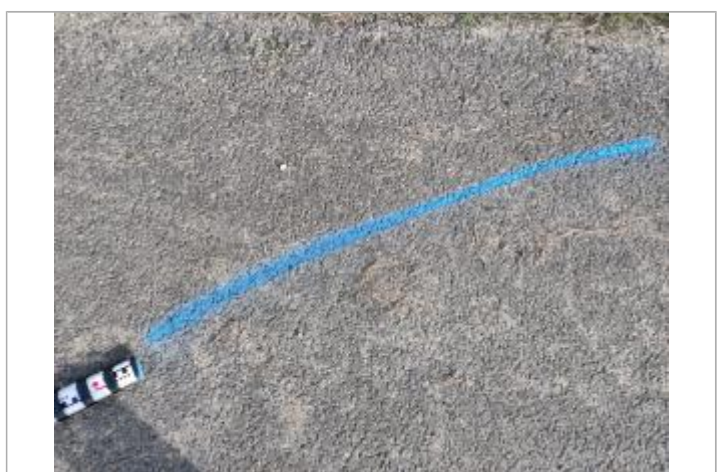
Dépôt sur la chaussée

GÉNÉRAL Code : 23_ORB22_R_59_1 Date de mise à jour : 26/04/2023 Auteur : SPC MO