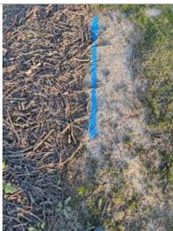
Dépôt au sol