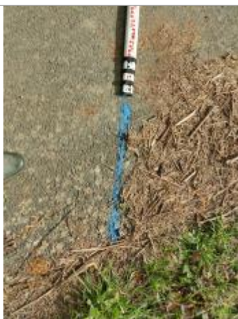
Dépôt sur la piste