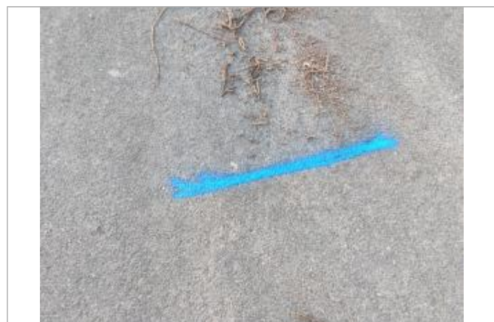
Dépôt sur la chaussée