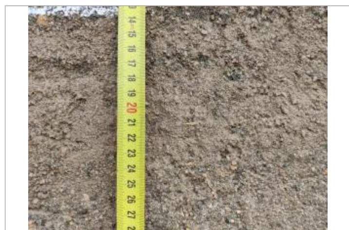
Trace sur le cadre