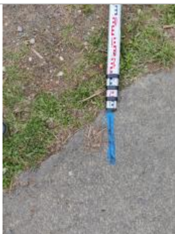
Dépôt sur la piste (débordement dans le canal)