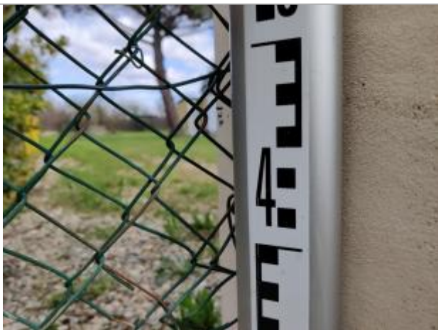
Marque faite par le propriétaire sur le montant

Altitude calculée de l'eau (en m) : 1.849