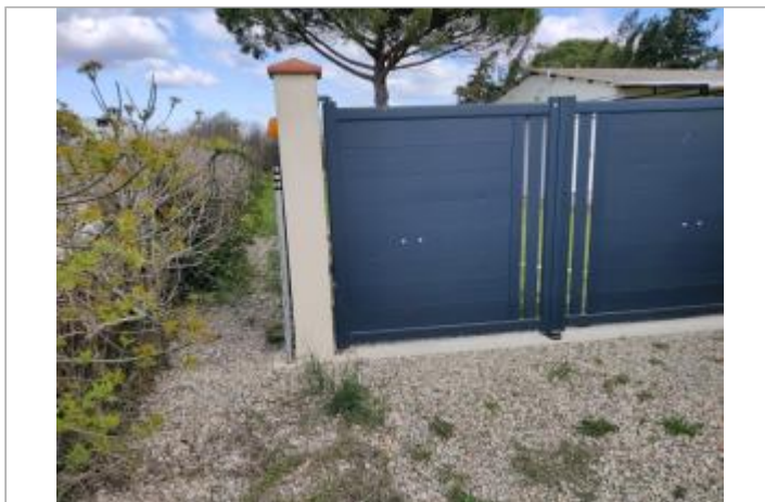
Montant de portail