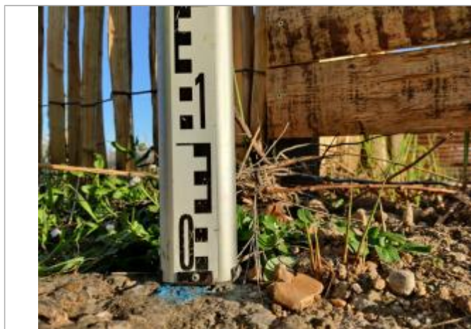
Dépôt contre la clôture