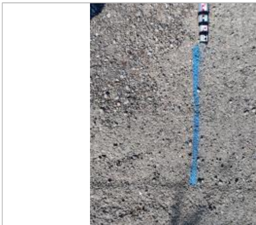
Dépôt sur la chaussée