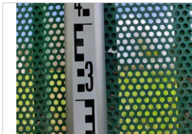
Trace sur le portail, 54cm sous le repère de crue de 1953

Altitude calculée de l'eau (en m) : 1.809