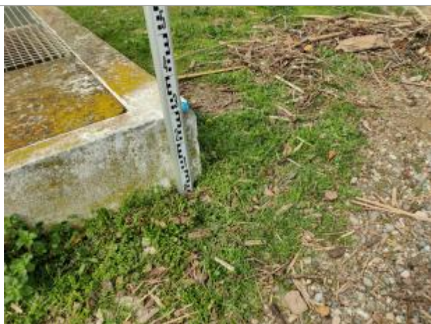
Dépôt contre le regard

Altitude calculée de l'eau (en m) : 1.812