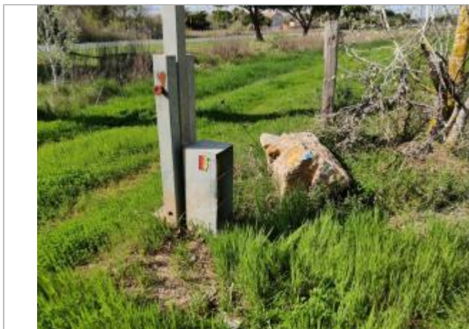
Rocher en bord de chemin