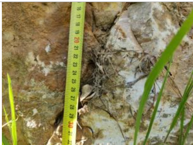
Dépôt contre le rocher

Altitude calculée de l'eau (en m) : 1.609