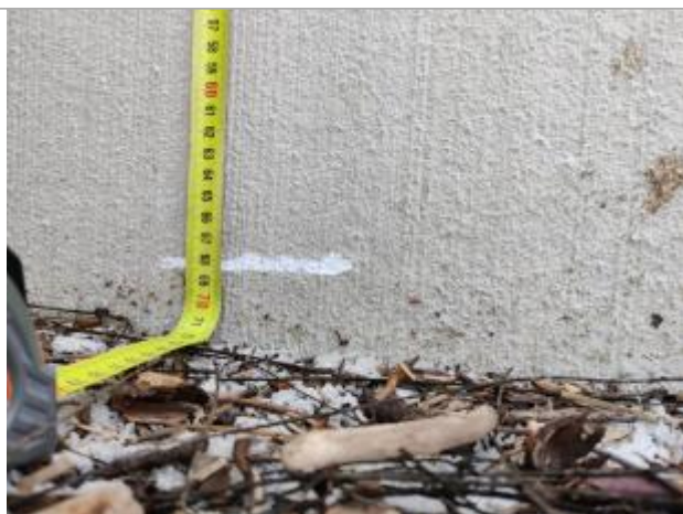
Trace sur le mur

Altitude calculée de l'eau (en m) : 1.582