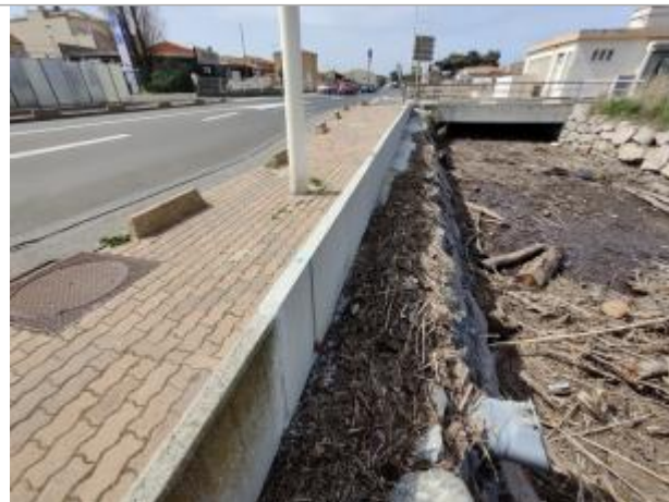
Mur digue du canal

Coordonnées WGS84 : X: 3.29610830 / Y: 43.25202480