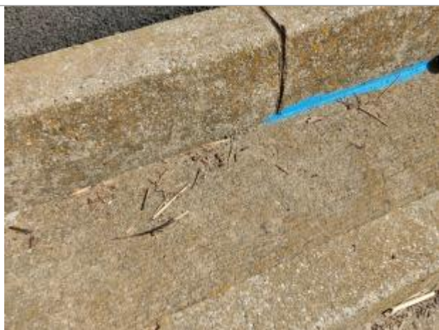
Dépôt sur la marche