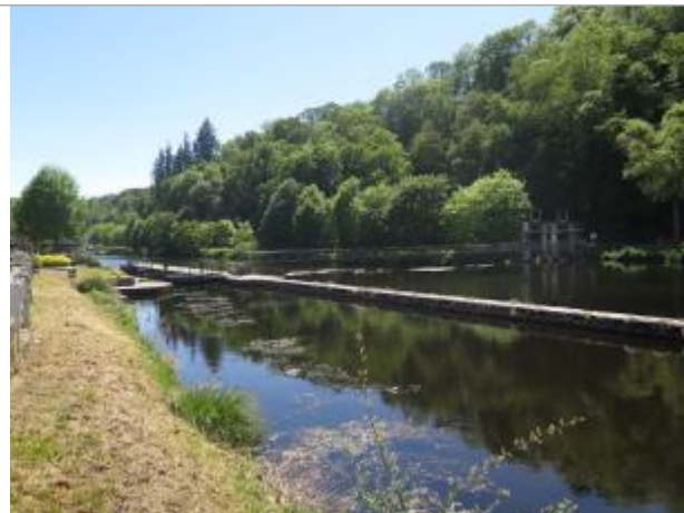
Amont de l'écluse de Saint-Nicolas-des-eaux