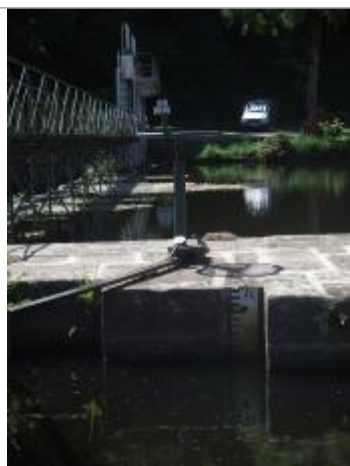
Echelle amont de l'écluse de Saint-Nicolas-des-eaux

Altitude calculée de l'eau (en m) : 42.44