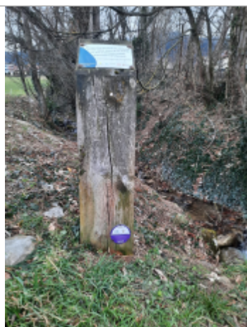
crue de 1999 du ruisseau de Beaumont