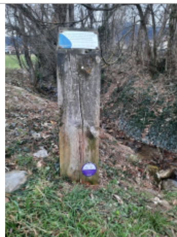
Crue de 1999 du ruisseau de Beaumont

Coordonnées RGF93 (ETRS89) : X: 6.119878 / Y: 46.106221