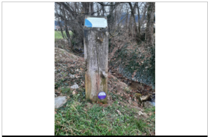
crue de 1999 du ruisseau de Beaumont

MARQUE Texte : Crue de 1999 du ruisseau de Beaumont Maximum de l'inondation : Oui Visibilité : Oui État du repère : Bon Pérennité : Longue Repère calculé : Non PHEC : Oui