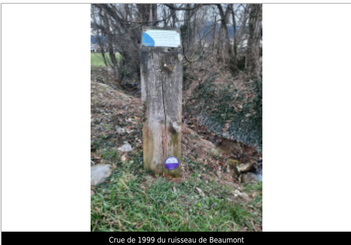
Crue de 1999 du ruisseau de Beaumont

GÉOLOCALISATION Coordonnées WGS84 : X: 6.11987795 / Y: 46.10622100 Coordonnées RGF93 (Lambert 93) : X: 940927.79 / Y: 6561030.01 Coordonnées RGF93 (ETRS89) : X: 6.119878 / Y: 46.106221