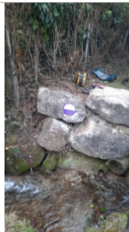
enrochement pont sur route de la Croisette (RD145)

Coordonnées RGF93 (ETRS89) : X: 6.1090106 / Y: 46.0980365