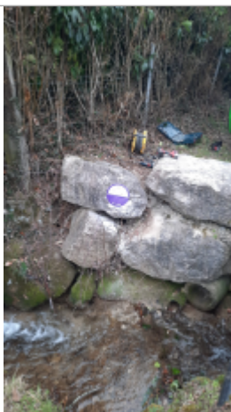
Nant de Bellot

Texte : Crues de 1999 et 2021 du Nant de Bellot