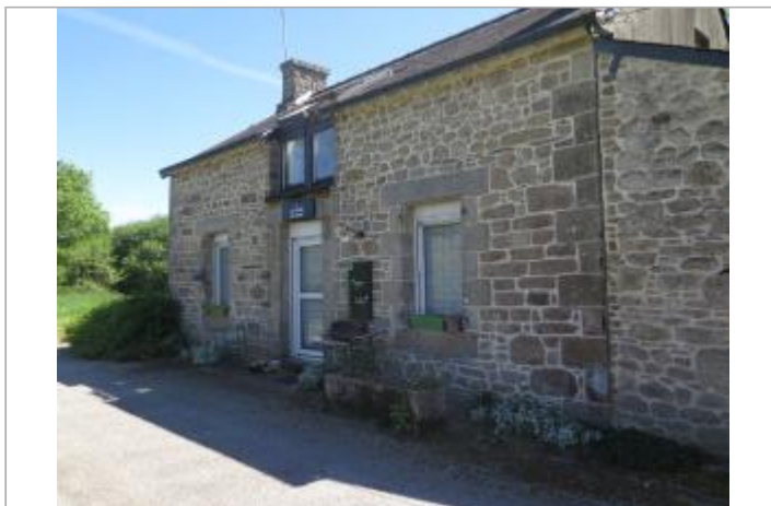
maison éclusière du Guern à Plumélieu-Bieuzy