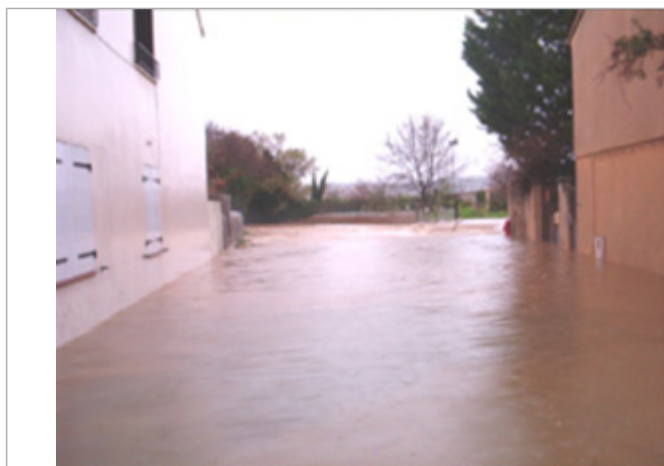
Rue du Camping - Vue vers l'Agau

SOURCE DE REPÉRAGE : ÉTUDE DES PHE DU TERRITOIRE DE THAU PAR LE SMBT (2021/22) -