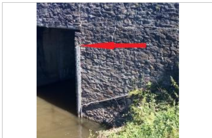
Echelle limnimétrique de la station Vigicrues de Cadoret-Pleugriffet

Altitude calculée de l'eau (en m) : 44.357 m