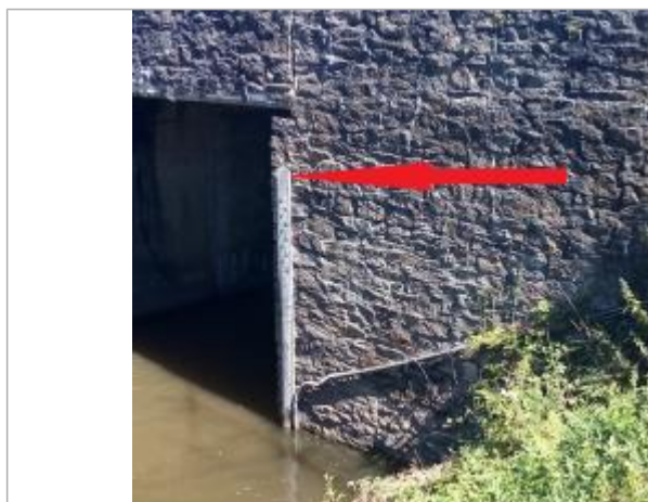
Niveau de la crue de janvier 1925 reporté sur l'échelle de la station Vigicrues

Altitude calculée de l'eau (en m) : 44.287 m