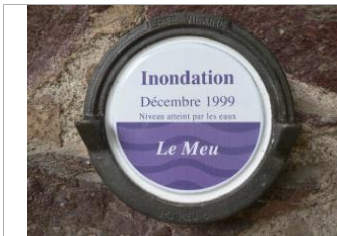
Repère normalisé de la crue du 28 décembre 1999

Altitude calculée de l'eau (en m) : 39.41 m