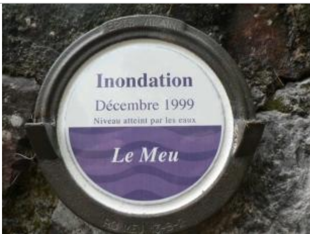
Repère normalisé de la crue du 28 décembre 1999

Altitude calculée de l'eau (en m) : 33.88 m