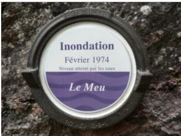
Repère normalisé de la crue du 12 février 1974

Altitude calculée de l'eau (en m) : 33.27 m