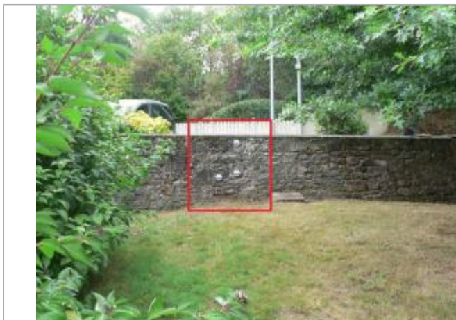
Muret, rue du 4 juin 1944