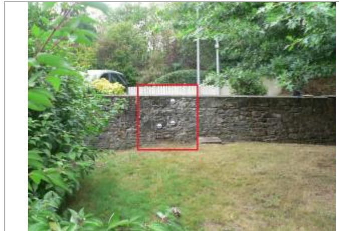
Muret, rue du 4 juin 1944

Coordonnées WGS84 : X: -1.95278063 / Y: 48.13482580