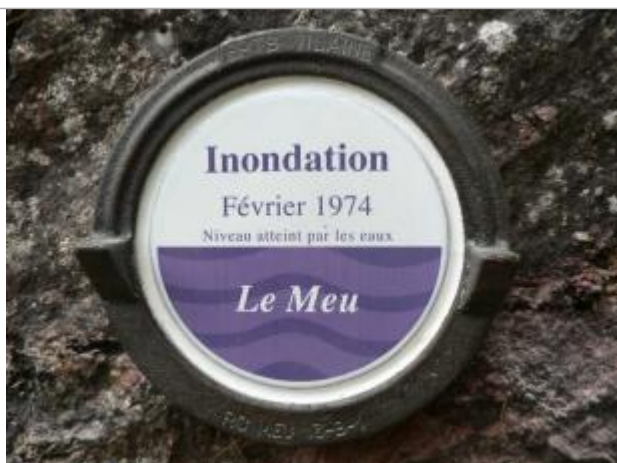
Repère normalisé de la crue du 12 février 1974

Altitude calculée de l'eau (en m) : 33.27 m