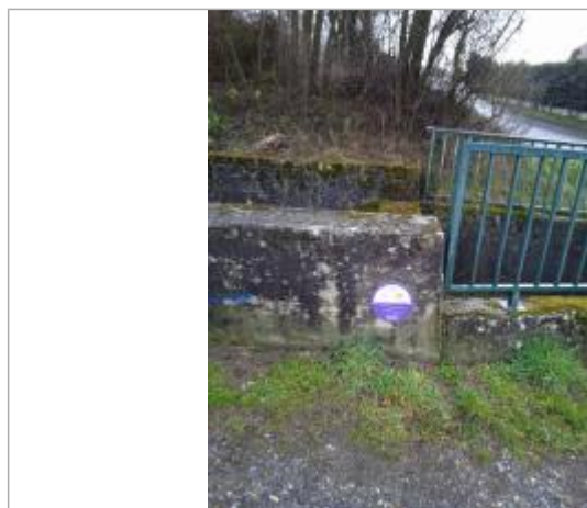
Les Diambes, crue de mai 2015, ruisseau de la Vignule