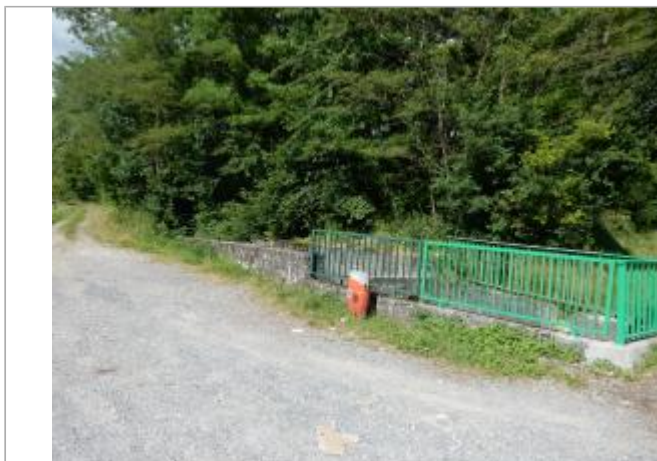
Lieu-dit Les Diambes ouvrage hydraulique du Département