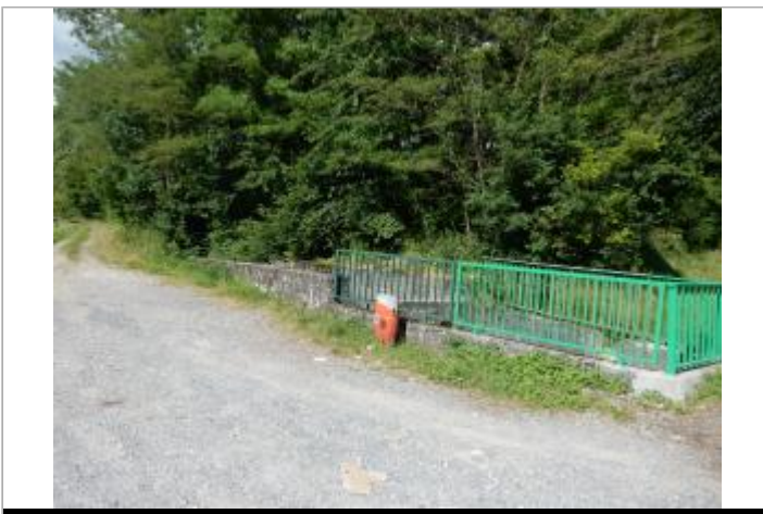
Lieu-dit Les Diambes ouvrage hydraulique du Département

GÉOLOCALISATION Coordonnées WGS84 : X: 6.30788449 / Y: 46.18383720 Coordonnées RGF93 (Lambert 93) : X: 955077.08 / Y: 6570232.72 Coordonnées RGF93 (ETRS89) : X: 6.3078845 / Y: 46.1838372