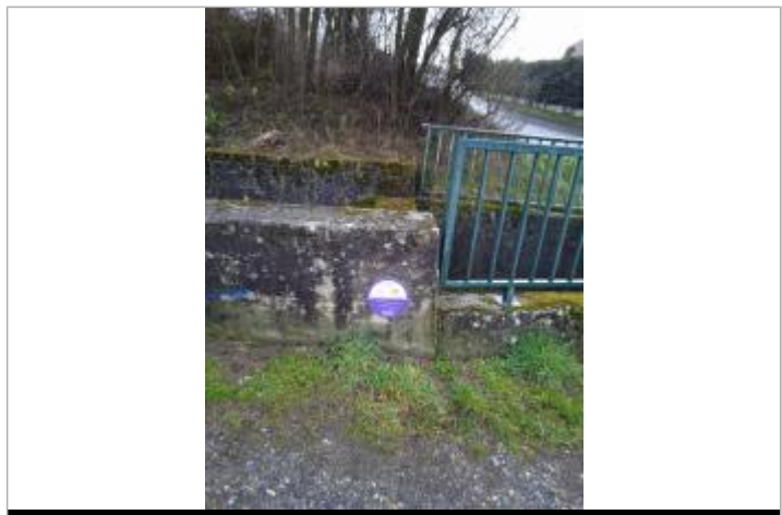
Les Diambes, crue de mai 2015, ruisseau de la Vignule

MARQUE Texte : crue de mai 2015, ruisseau de la Vignule Maximum de l'inondation : Oui Visibilité : Oui État du repère : Bon Pérennité : Longue Repère calculé : Non PHEC : Oui