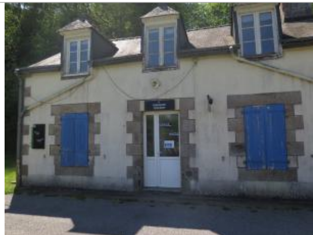
Maison éclésièrre de Rimaison à Plumélieu-Bieuzy