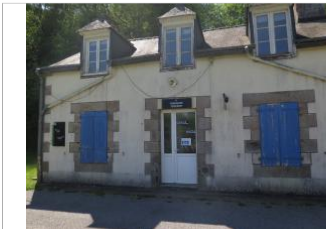
Maison éclésièrre de Rimaison à Plumélieu-Bieuzy