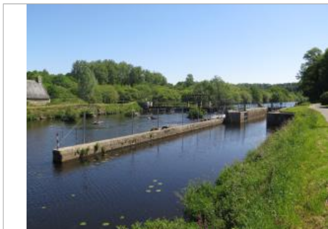
aval de l'écluse de Rimaison

Altitude calculée de l'eau (en m) : 46.32