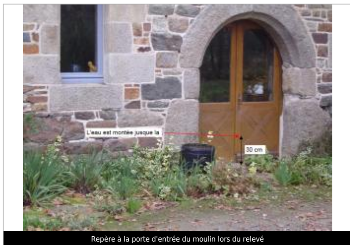
Repère à la porte d'entrée du moulin lors du relevé

Altitude calculée de l'eau (en m) : 125.01 m