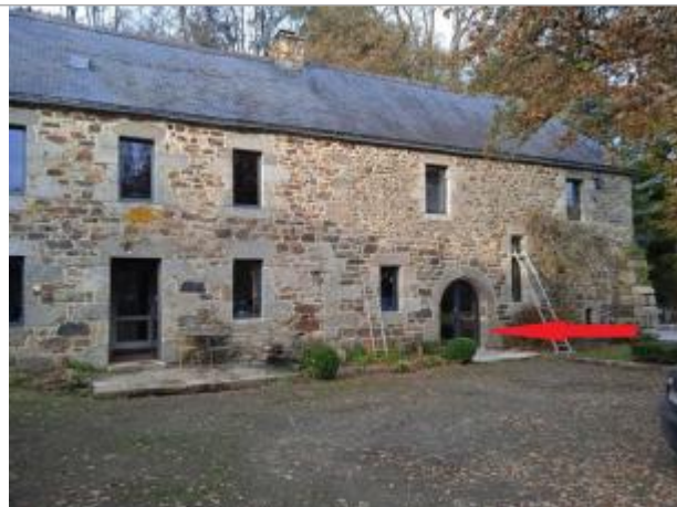
Moulin de la Boissière en 2023