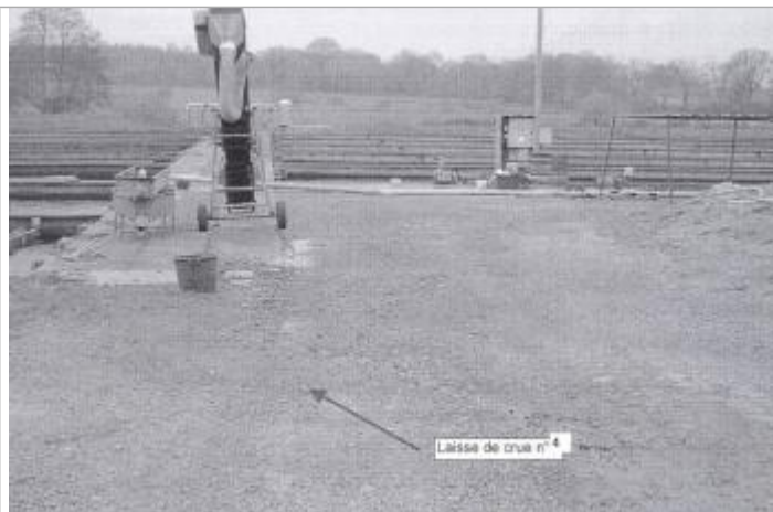
Limite de l'inondation près des bassins de la pisciculture lors du relevé

Altitude calculée de l'eau (en m) : 140.8 m