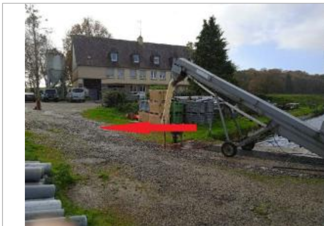
Pisciculture en 2023