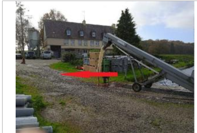
Pisciculture en 2023