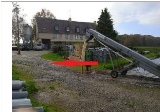
Pisciculture en 2023