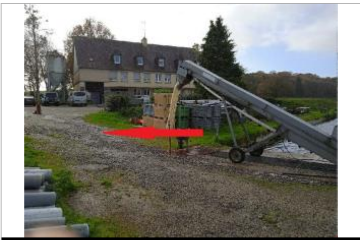
Pisciculture en 2023

GÉOLOCALISATION Coordonnées WGS84 : X: -3.18235658 / Y: 48.28203510 Coordonnées RGF93 (Lambert 93) X: 241844.83 / Y: 6815911.72 Coordonnées RGF93 (ETRS89) : X: -3.1823566 / Y: 48.2820351 Code Hydro: J5--0210 Rive de référence: Droite