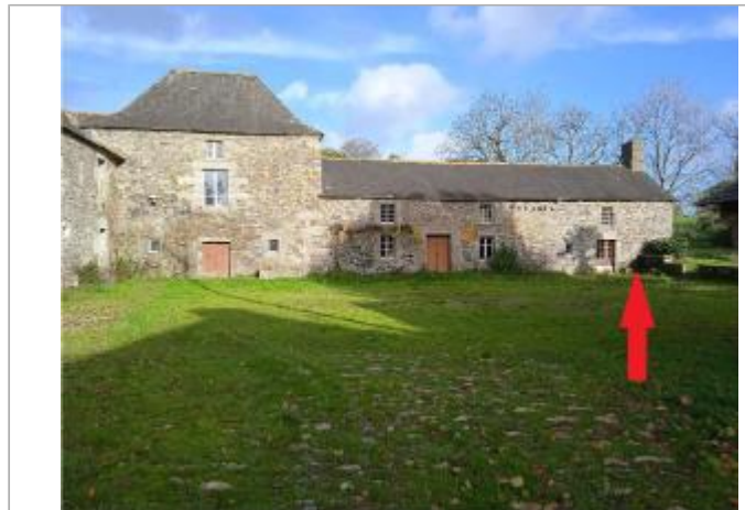
bâtiments en 2023

Coordonnées WGS84 : X: -3.19498129 / Y: 48.27631680