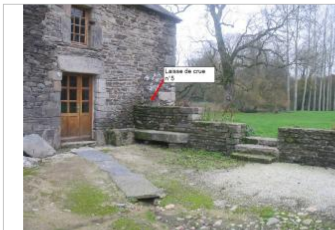
Muret sur le coté du bâtiment lors du relevé

Altitude calculée de l'eau (en m) : 140.14