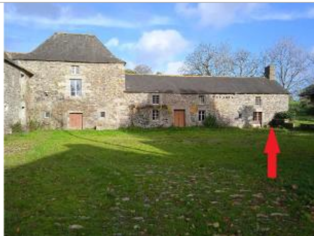
bâtiments en 2023