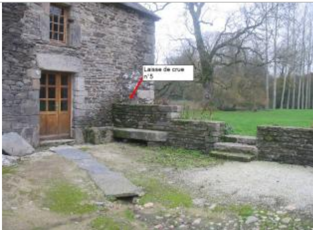
Muret sur le coté du bâtiment lors du relevé

Altitude calculée de l'eau (en m) : 140.14