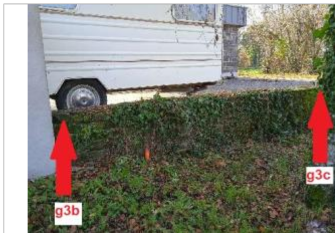
Muret devant les sanitaires du camping

Altitude calculée de l'eau (en m) : 131.26