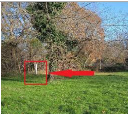
Camping et borne électrique en 2023